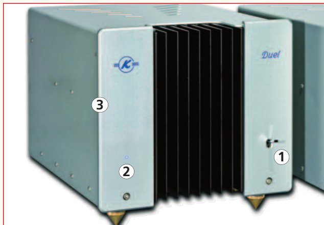
Vue du panneau avant

1 - Interrupteur de mise sous tension. 2 - Voyant indicateur. 3 - Façade aluminium de 8 mm d'épaisseur.