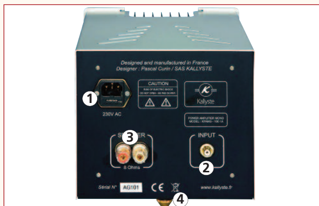
Vue de la plaque technique arrière

1 - Interrupteur de mise sous tension. 2 - Voyant indicateur. 3 - Façade aluminium de 8 mm d'épaisseur.